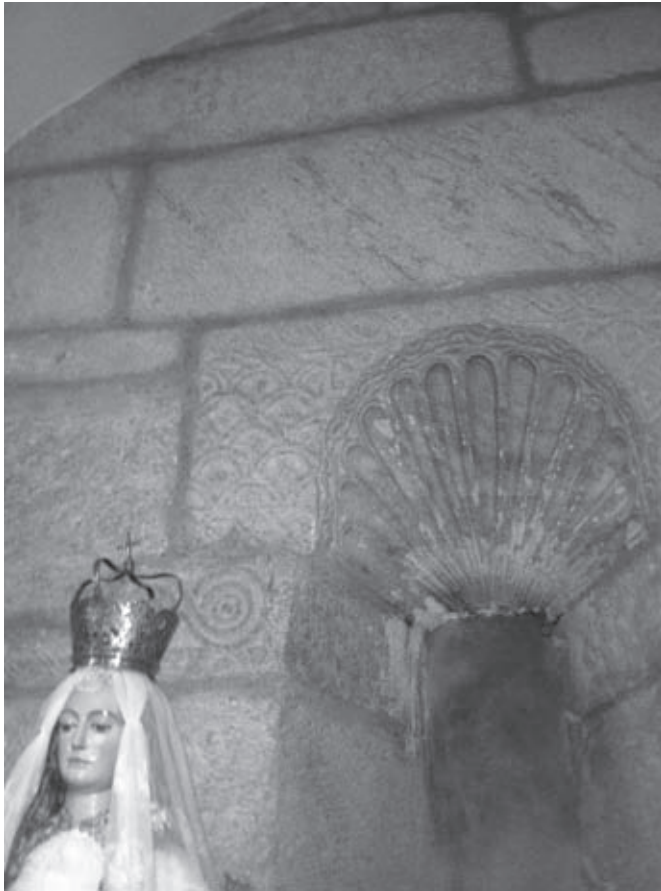
Figura n.º 1 – Igreja de Vera Cruz de Marmelar. Absidiolo sul. Interior. Decoração de fresta.

cação, tanto mais que o primitivo “monasterium” de Marmelar se situaria na herdade de Beja que D. João de Aboim outorgou aos Hospitalários, em 1271. Assim sendo, a Ordem disporia de um conjunto edificado numa área periférica em relação aos seus interesses. Deixando de lado estas razões mais pragmáticas, há outro tipo de motivações que podem ter influenciado a decisão de incorporação de peças visigóticas e/ou moçárabes nas obras do século XIII, bem como nas que seriam realizadas no século XVI. Antes de mais, a antiguidade e o prestígio do templo a que inicialmente pertenceriam e que se localizaria mais a Sul em direção ao Rio Guadiana, à margem de uma comenda que se quer centrar e aproximar do senhorio de Portel, atendendo às ligações pessoais dos seus dois titulares: D. Afonso Peres Farinha e D. João Peres de Aboim, respetivamente. Em segundo lugar, não podemos deixar de colocar a hipótese de esse templo primitivo abrigar já uma relíquia do Santo Lenho, eventualmente deslocada para a igreja de Vera Cruz numa época posterior, como de seguida explicaremos. Em terceiro lugar, a necessidade de incorporação de testemunhos pétreos de um passado pré-muçulmano, em que o espaço a Sul do Tejo tinha um carisma emblemático e se articulava em função do conceito de Guerra Santa.