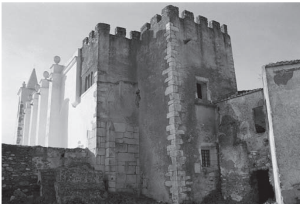
Figura n.º 2 – Igreja de Vera Cruz de Marmelar. Cabeceira, absidiolo sul Fonte: IHRU, IP/SIPA (Sistema de Informação para o Património Arquitetónico) FOTO.00188426.

O que hoje em dia podemos observar em Vera Cruz não é a igreja com o aparato que lhe foi dado no momento da sua construção do século XIII, pois houve diversas intervenções posteriores que foram alterando a sua traça original 25 . Estas circunstâncias têm conduzido as duas interpretações. Uma considera que as capelas laterais construídas na sua base com silhares bem aparelhados em “opus quadratum”, (Figura n.º 2) datam da época visigótica 26 . Uma outra, tendo em conta que as peças decoradas com motivos da época visigótica mostram ter sido truncadas (como, por exemplo, no caso dos frisos interiores dos dois absidiolos), defende que na época moçárabe houve uma reconstrução de um edifício de funcionalidade religiosa anterior que incorporou esses elementos mais antigos 27 .