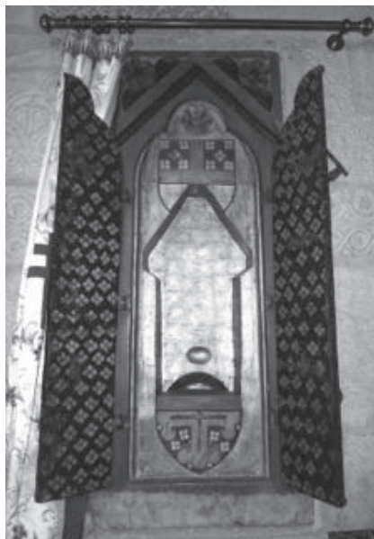
Figura n.º 7 – Igreja de Vera Cruz de Marmelar. Edícula da relíquia do Santo Lenho.

A ação de frei D. Álvaro Gonçalves Pereira, ou mesmo do seu filho, o condestável D. Nuno Álvares Pereira, está presente na igreja de Vera Cruz, precisamente nas duas peças mais simbólicas do seu património: a edícula que guarda a relíquia do Santo Lenho e a Cruz Processional em prata e esmaltes translúcidos, que apresentam as armas dos Pereira e da Ordem do Hospital 33 (Figuras números 7 e 8).