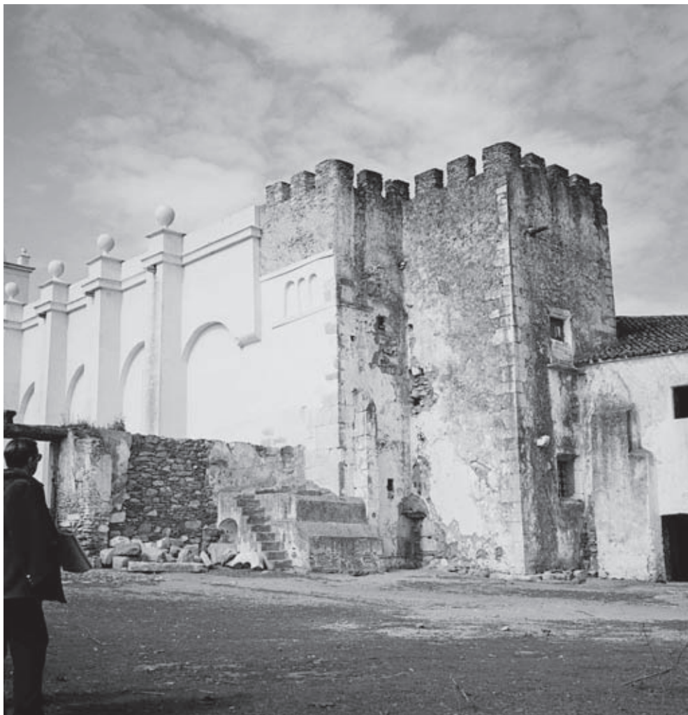
Figura n.º 6 – Igreja de Vera Cruz de Marmelar. Torre vista do lado sul. Fonte: IHRU/SIPA (Sistema de Informação para o Património Arquitetónico) FOTO.00161964.

Terá sido a construção da torre que levou ao alteamento dos absidiolos da igreja. De facto, numa primeira observação parece que há uma articulação perfeita entre a volumetria e o aparelho usado na parte superior dos absidiolos e aquele que foi empregue na torre. Todo este conjunto é unificado por um coroamento em merlões, o que lhe confere um aspeto de igreja-fortaleza, que não conheceria no século XIII. Esta retórica militar era comum no seio da Ordem do Hospital, como demonstram os exemplos de Leça do Balio e da Flor da Rosa, ambos do século XIV, embora incongruente com uma época de poucos rendimentos e de ausência de guerra sistemática nos territórios em que se situavam.