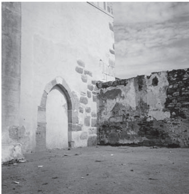
Figura n.º 4 – Igreja de Vera Cruz de Marmelar. Fachada sul. Portal entaipado