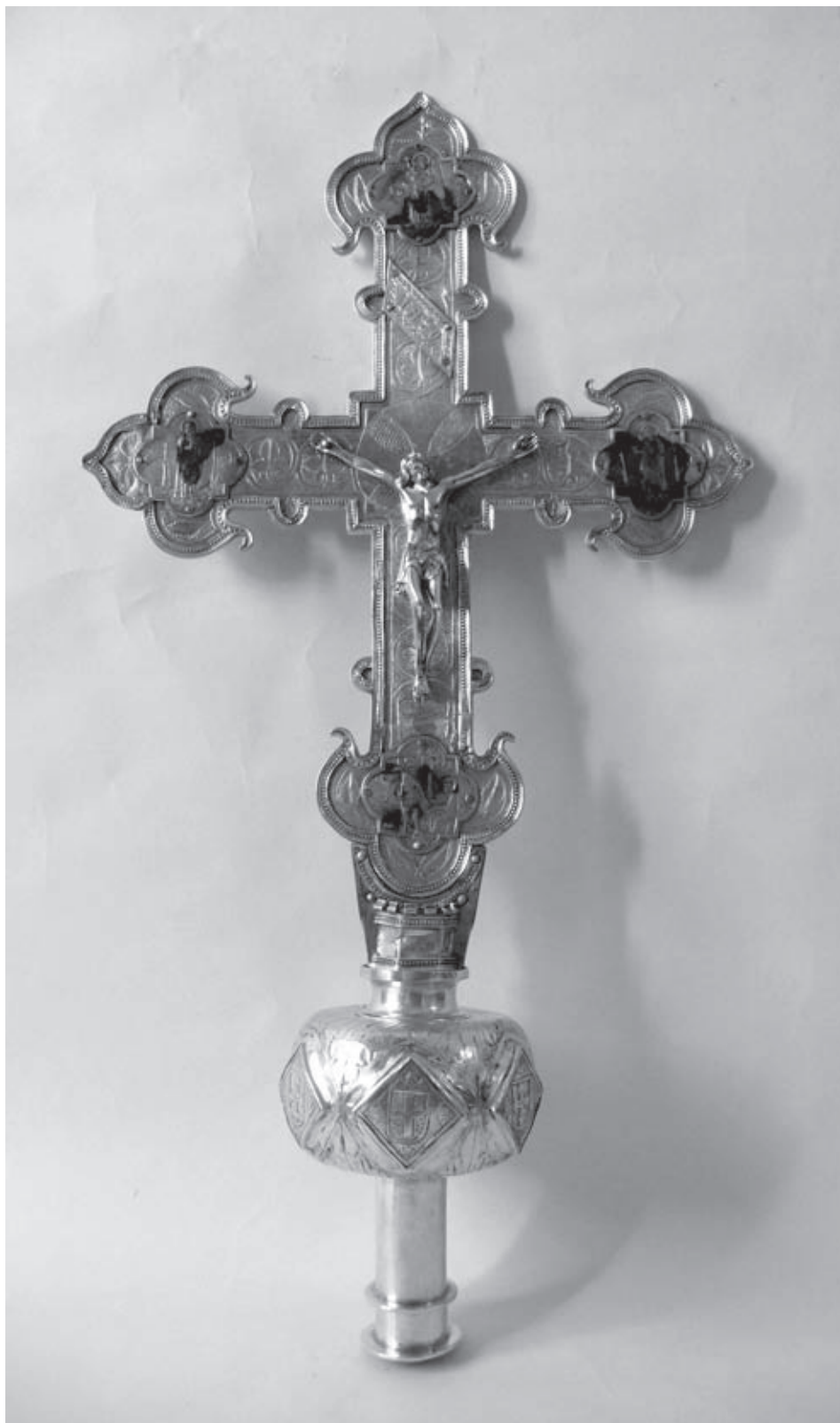
Figura n.º 8 – Igreja de Vera Cruz de Marmelar. Cruz processional.