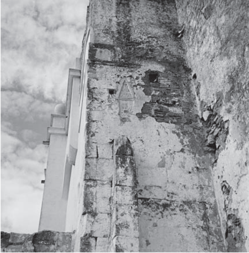
Figura n.º 5 – Igreja de Vera Cruz de Marmelar. Cabeceira. Exterior. Peças da época visigótica reaproveitadas.

O apuramento da cronologia da construção da torre não é tarefa fácil, se tivermos em conta o aparelho utilizado. Uma leitura apressada desta torre remete-nos para a época manuelina, na medida em que existe um vão de iluminação com padieira de arco mistilíneo. A par deste apontamento, há nas imediações da igreja outras peças decoradas ao gosto manuelino, o que era ainda mais evidente nas construções conventuais conforme documentam as fotografias das décadas de quarenta e cinquenta do século XX 31 . Porém, a existência destes elementos não é suficiente para se afirmar que a torre, pelo menos na sua origem, seja do século XVI. Na verdade, o aparelho irregular de que é feita tanto a pode situar no século XIV, como no XV, ou mesmo no XVI (Figura n.º 6). Quer isto dizer, que o vão de iluminação pode ter adquirido uma nova moldura na campanha de obras desenvolvida no século XVI, embora o esclarecimento destas questões só possa logrado com uma intervenção arqueológica completa e com o recurso à arqueologia da arquitetura.